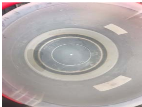
บริเวณบ้านหนองแดงด้านเหนือ