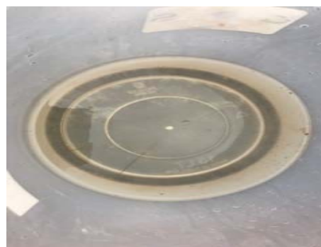
บริเวณบ้านหนองแดงด้านใต้