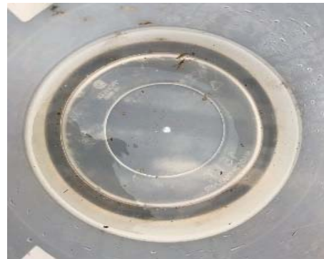
บริเวณบ้านหัวนา