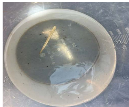
บริเวณบ้านโคกน้อย